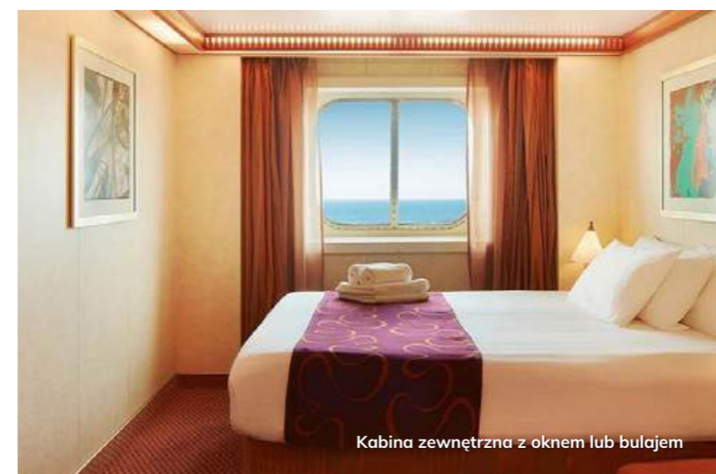
Kabina zewnętrzna z oknem lub bulajem