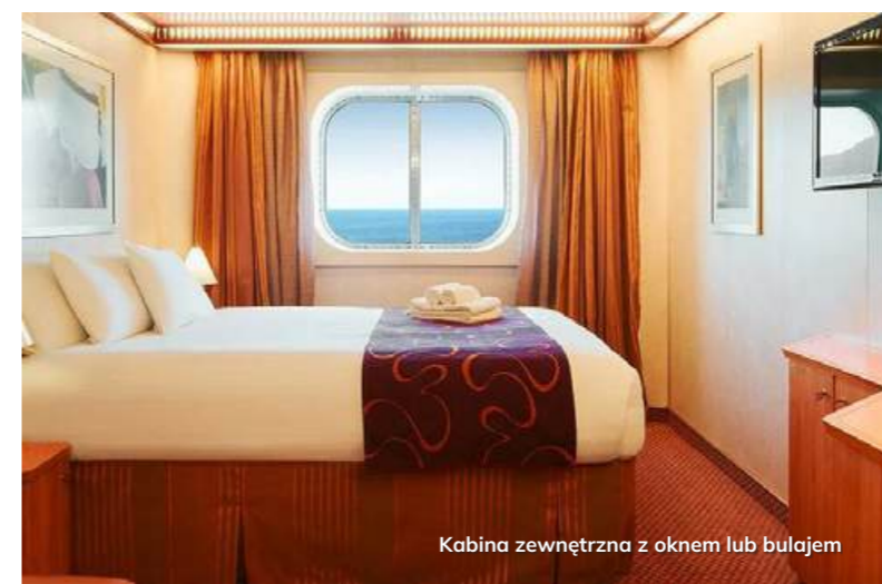
Kabina zewnętrzna z oknem lub bulajem