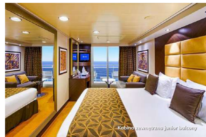
Kabina zewnętrzna junior balcony