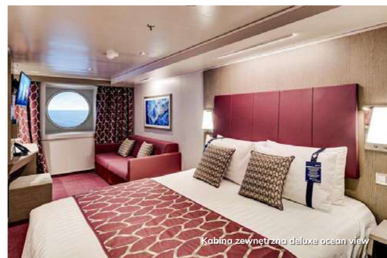
Kabina zewnętrzna deluxe ocean view