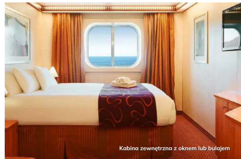
Kabina zewnętrzna z oknem lub bulajem