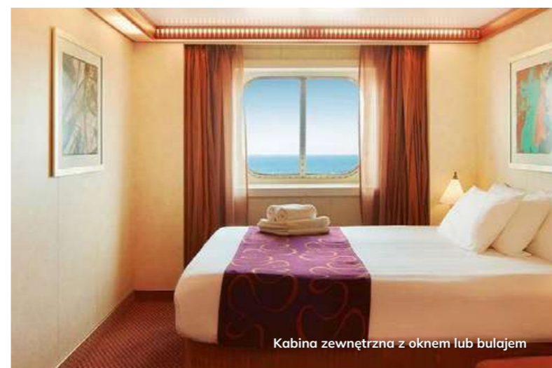
Kabina zewnętrzna z oknem lub bulajem