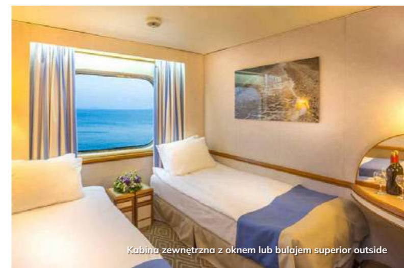
Kabina zewnętrzna z oknem lub bulajem superior outside