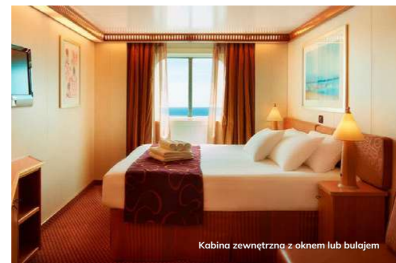
Kabina zewnętrzna z oknem lub bulajem