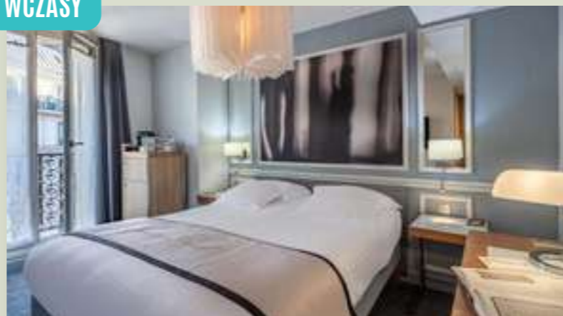
FRANCJA HÔTEL LITTÉRAIRE LE SWANN**** (HBX6018)