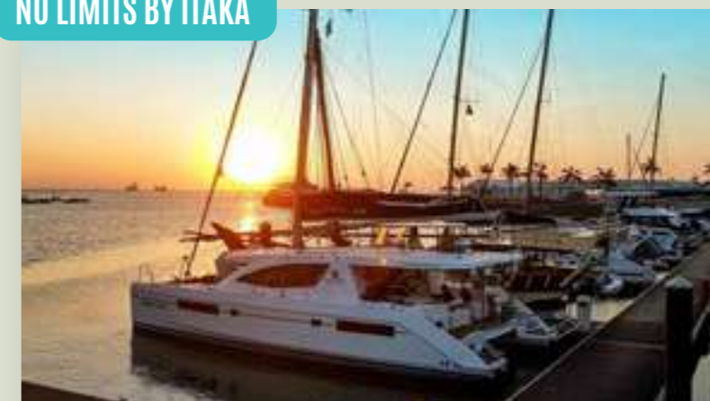
ZANZIBAR REJS AHOJ PEMBA! (ZNZREJ3)