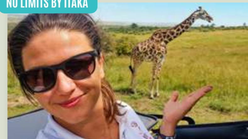
KENIA DZIEWCZYNY W DRODZE: KENIA! (MBAMISS)