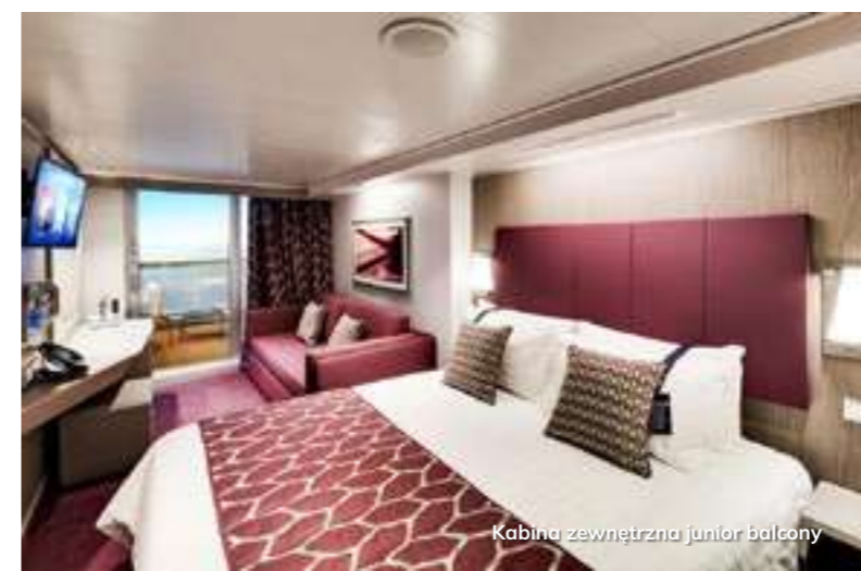
Kabina zewnętrzna junior balcony