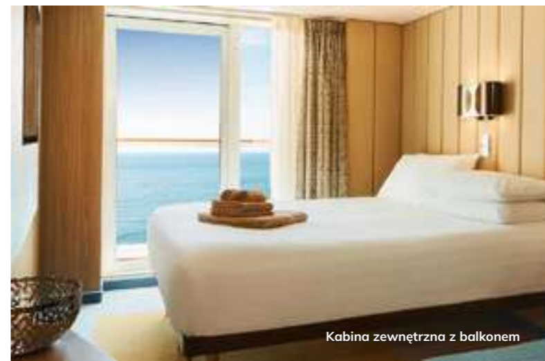
Kabina zewnętrzna z balkonem