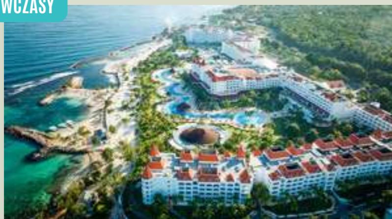
JAMAJKA BAHIA PRINCIPE LUXURY RUNAWAY BAY***** (MBJLUXU)