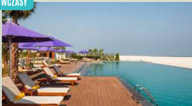
DUBAJ CENTARA MIRAGE BEACH RESORT DUBAI**** (DXBCMBR)