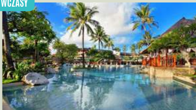
BALI HOTEL NUSA DUA BEACH & SPA***** (DPSNUDP)