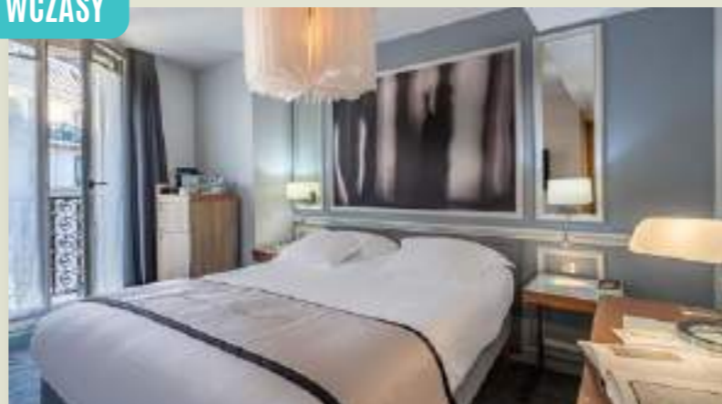
FRANCJA HÔTEL LITTÉRAIRE LE SWANN**** (HBX6018)