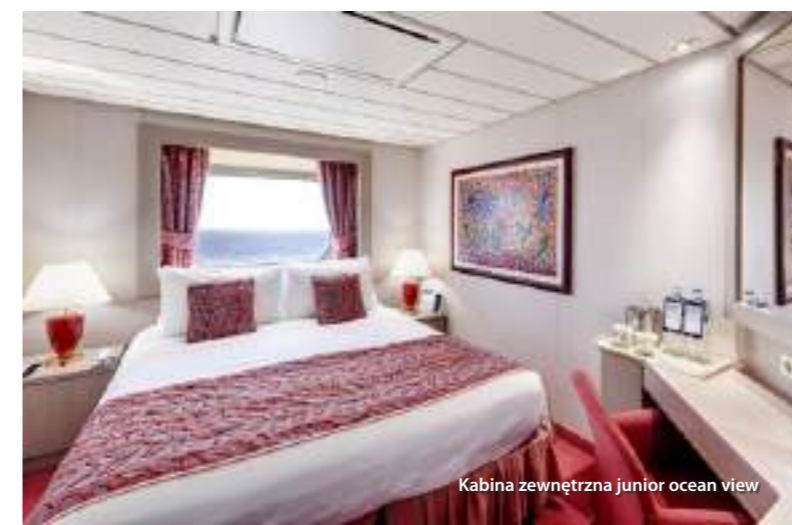
Kabina zewnętrzna junior ocean view