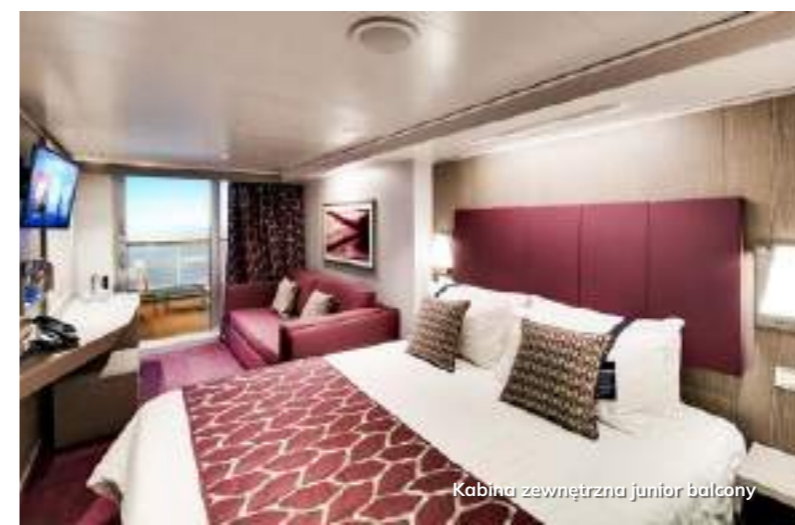
Kabina zewnętrzna junior balcony