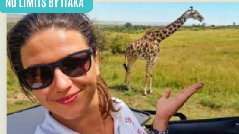
KENIA DZIEWCZYNY W DRODZE: KENIA! (MBAMISS)