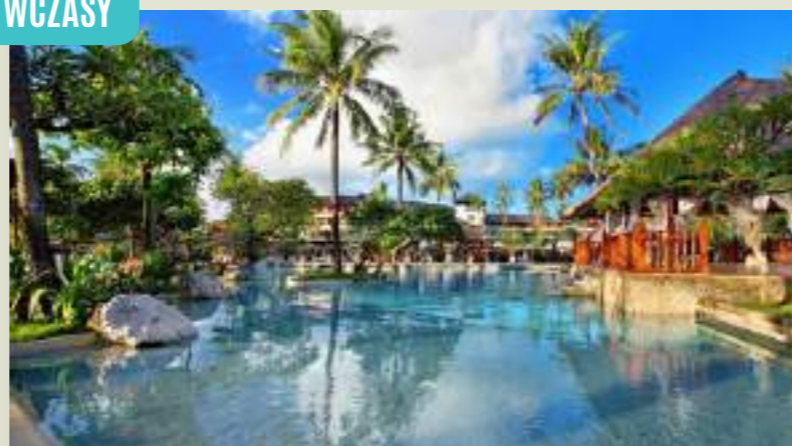
BALI HOTEL NUSA DUA BEACH & SPA***** (DPSNUDP)