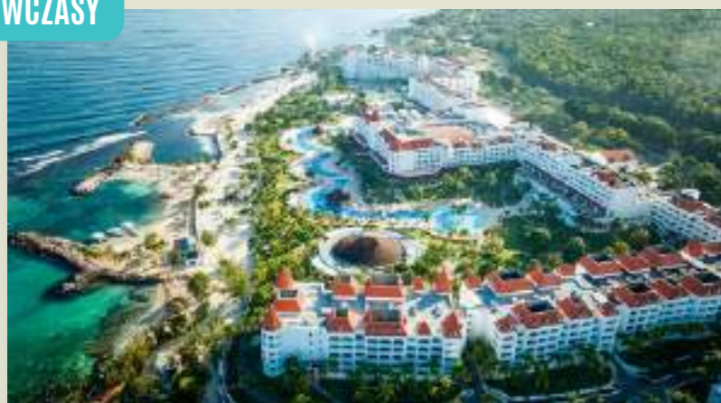
JAMAJKA BAHIA PRINCIPE LUXURY RUNAWAY BAY***** (MBJLUXU)