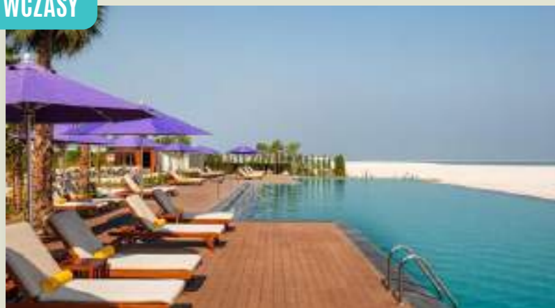
DUBAJ CENTARA MIRAGE BEACH RESORT DUBAI**** (DXBCMBR)