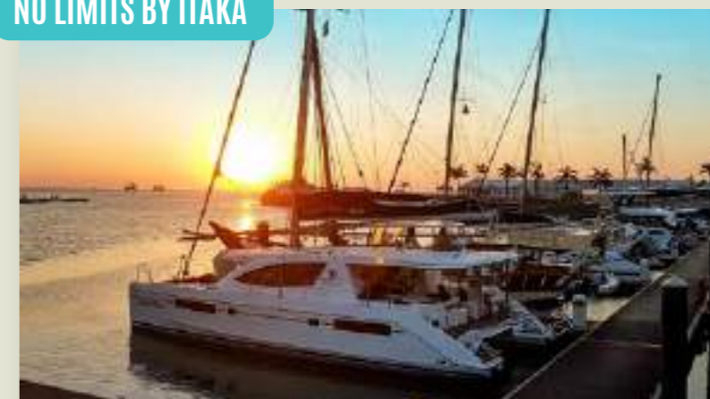
ZANZIBAR REJS AHOJ PEMBA! (ZNZREJ3)